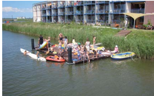
Anlegesteg für Kanus