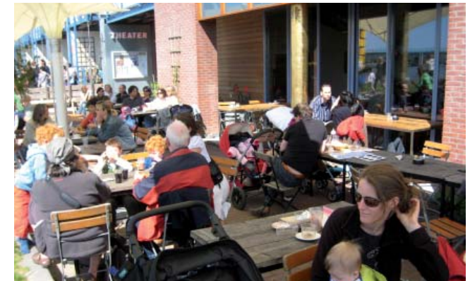
Terrasse des Vrijburch Cafés