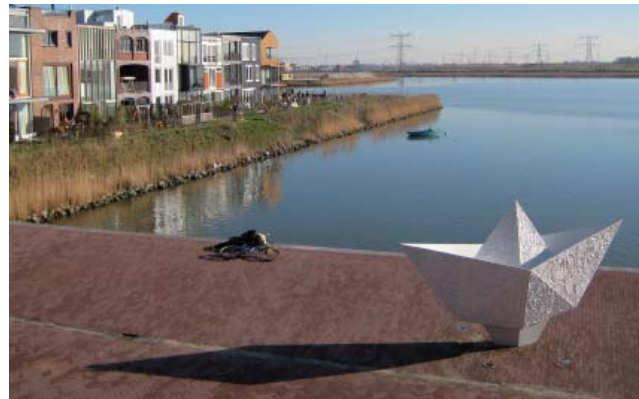
Kunstwerk auf dem Quai, gestiftet von Vrijburch