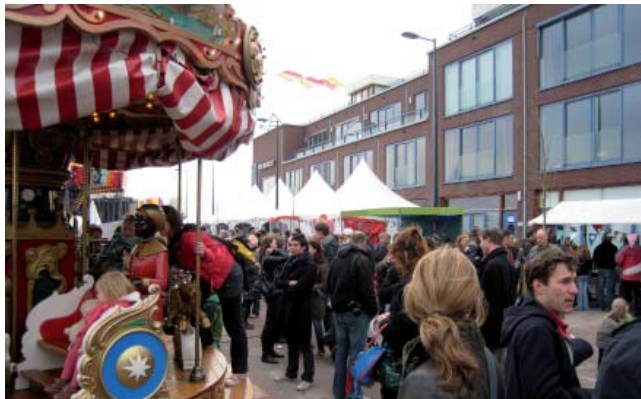
Festival am Quai