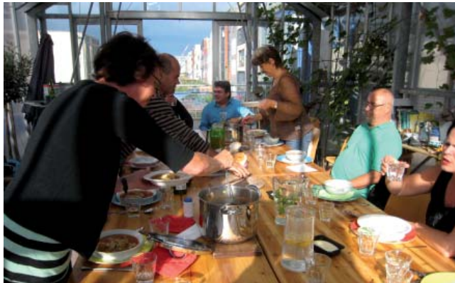
Gemeinsames Essen im Gewächshaus