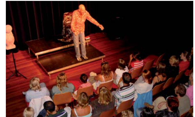
Komiker Peter Faber im Vrijburch Theater