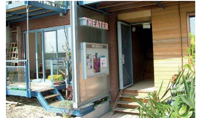
Eingang zum Vrijburch Theater