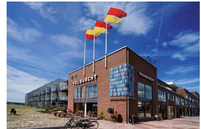
Ansicht von der Fahrradbrücke