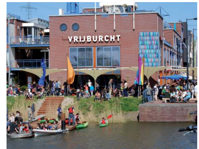
Öffentliches Leben am Quai