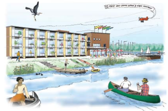
Impression für die Verkaufsfase