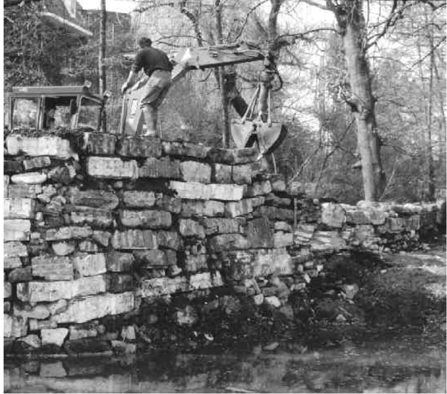
Werkzaamheden tijdens de aanleg