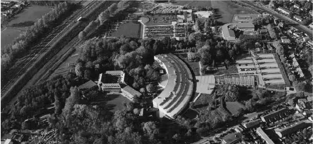
Luchtfoto van het terrein Larenstein

Daarover moest met vele partijen overlegd worden in een bijzonder korte tijd. Hiervoor is in nauw overleg met de bouwcoördinator en de architect door ons een voorlopig schetsontwerp gemaakt in de vorm van een maquette. We vroegen ons af of de maquette wel hanteerbaar genoeg was voor de vertegenwoordiger van Larenstein die het plan moest presenteren. De truc was om de maquette in een doorzichtige perspex diplomatenkoffertje te laten bouwen, zodat hij makkelijk mee te nemen was. Meer dan twee jaar lang is deze koffer vele malen gebruikt door de bouwcoördinator, de architect, de directie van Larenstein en diverse anderen om overleg te plegen over de bestemmingsplanprocedure, voor aanlegsubsidies van het Ministerie van LNV en in personeels- en omwonendenoverleg. Achteraf gezien heeft de koffer een belangrijke rol gespeeld in het verwerven van de nodige aanlegkosten. Het werkte zelfs zo goed