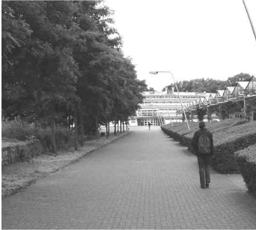
Ingangspartij met de onder een hoek geplaatste lichtmasten