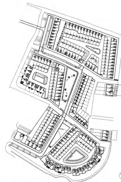
LEVS architecten en VLUGP Stedebouw & Landschapsarchitectuur, stedenbouwkundig plan Leeuwendeld 2