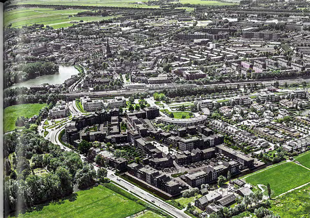
Weesp, op voorgrond Leeuwendeld 2

Om de ontwikkeling van Leeuwendeld 2 tijdens de crisis overeind te houden, besloot Blauwhoed Eurowoningen een deel van de woningen over te hevelen naar de huurmarkt; ze werden verkocht aan een belegger en een woningcorporatie.